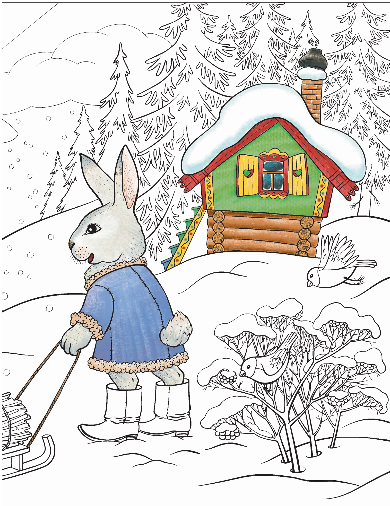
Русская народная сказка «Заюшкина избушка»