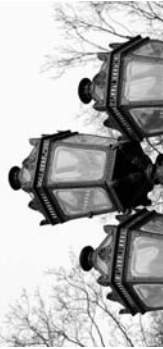
Фонарь Дома Ломоносова