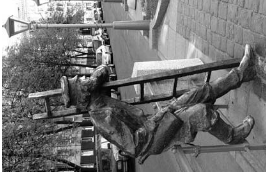
Музей уличных фанарей под открытым небом на Одесской улице

Государственное бюджетное дошкольное образовательное учреждение «Детский сад № 19 комбинированного вида» Центрального района Санкт-Петербурга