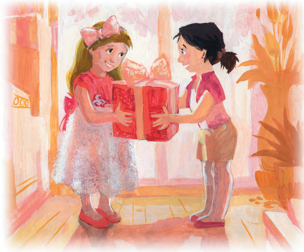
«Благодарность и ответ на нее». Рис. 3 (второй год обучения)