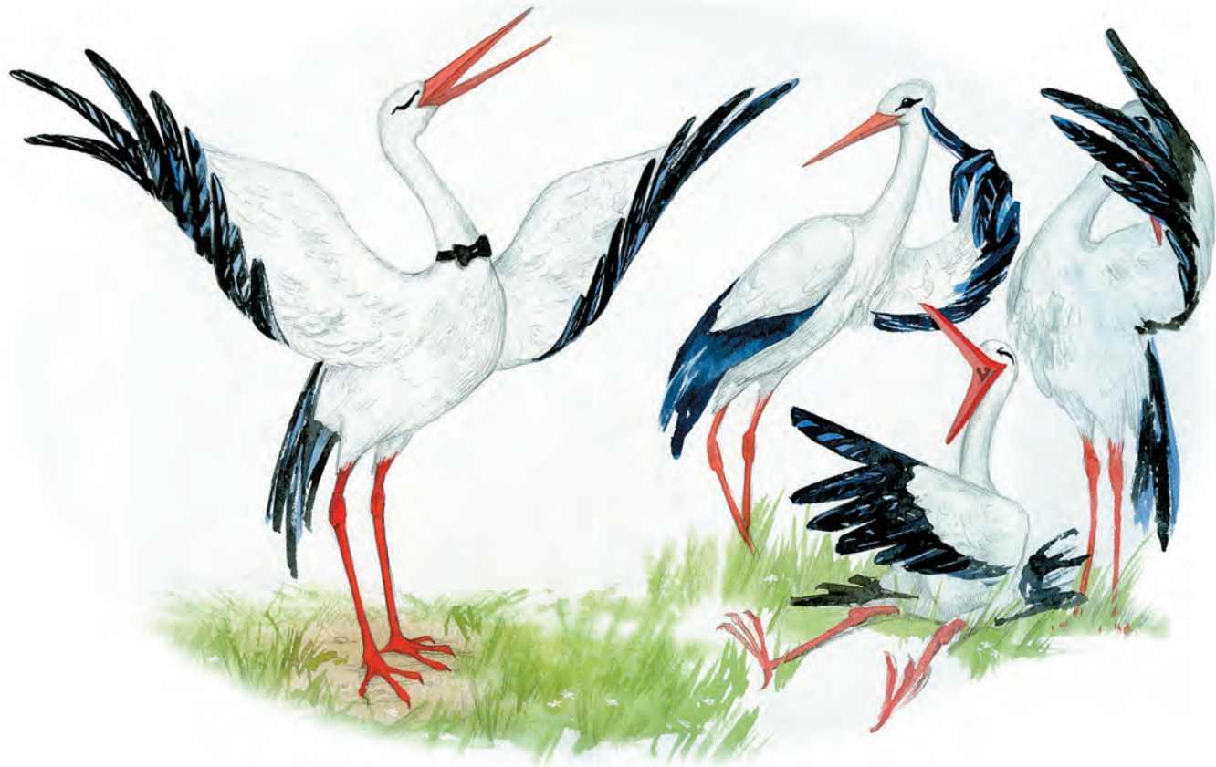
«Аист и соловей». Рис. 16 (первый год обучения)