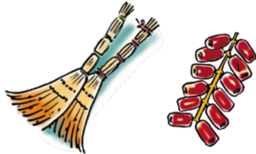
веники — финики