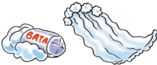
вата — фата