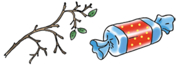
ветка — конфетка