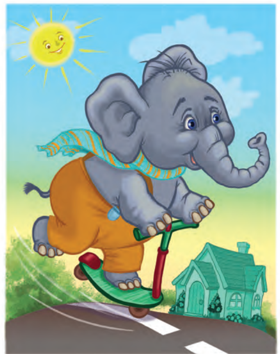
Рис. 4. «Слон едет на самокате по улице».