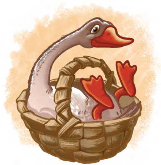
Рис. 2. «Гусь в корзине».