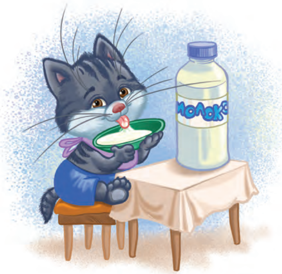
Рис. 1. «Котёнок лакает молоко из блюда».