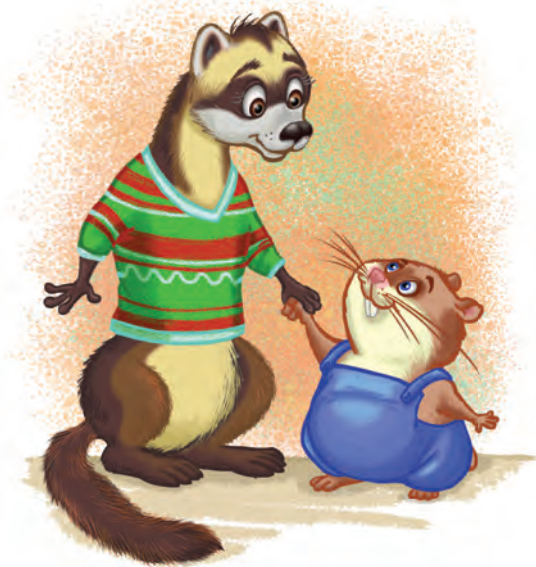
Рис. 3. «Это хомяк и хорёк».