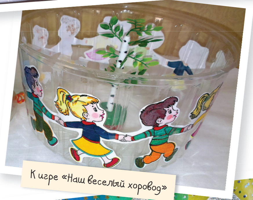
К игре «Наш веселый хоровод»