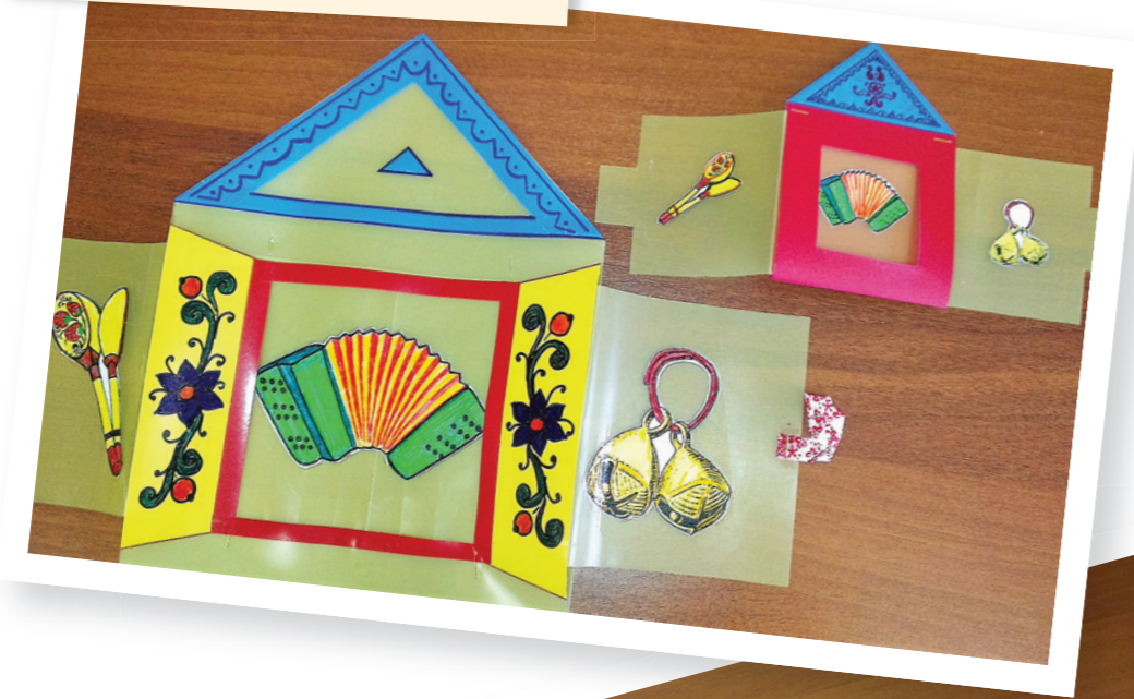
К игре «Музыкальный домик»