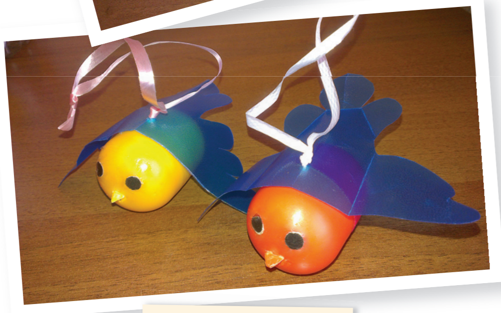
К игре «Найди пару»