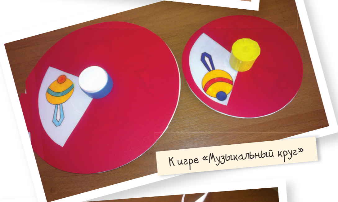
К игре «Музыкальный круг»