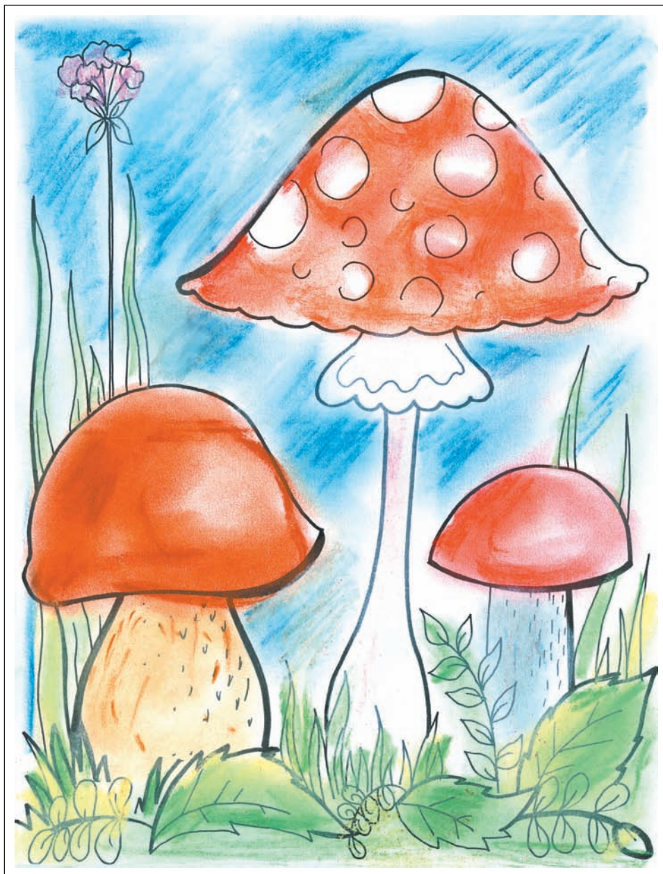
Портрет гриба «Простое» описание на стр. 34