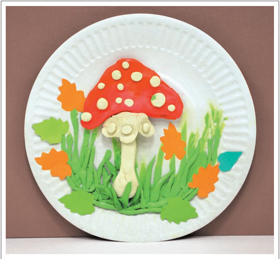
Портрет гриба «Сложное» описание на стр. 35