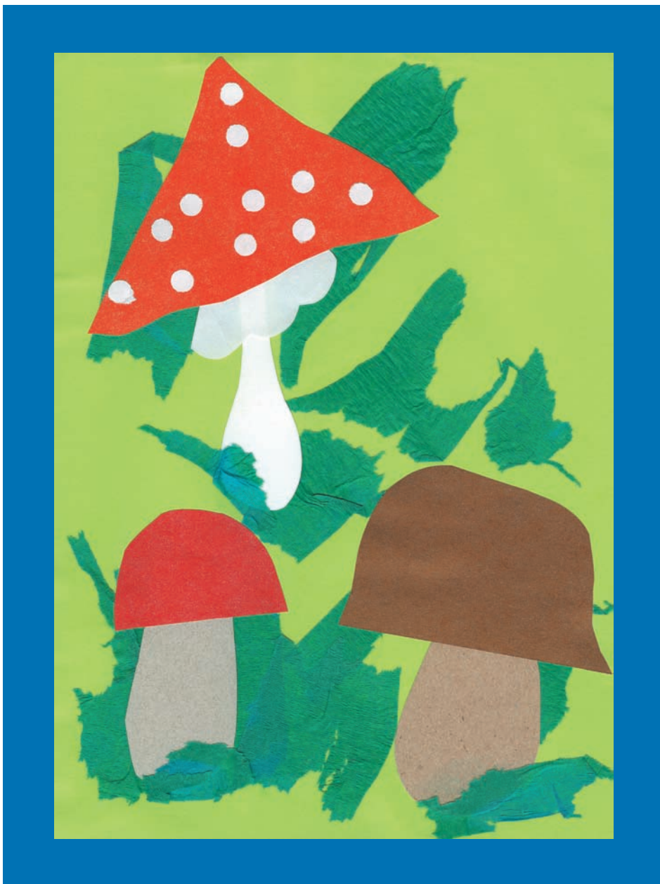
Портрет гриба «С усложнением» описание на стр. 35